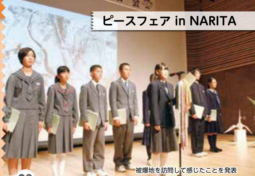
被爆地を訪問して感じたことを発表