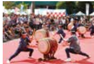
力強い和太鼓の演奏

日時=10月7日(日)(雨天の場合は10月8日(月)) 午前9時30分~午後5時 会場=公津の杜駅周辺 内容=ダンスなどの発表、徳之島フェア、模擬店など ※くわしくは実行委員会事務局(ぴーぽっが成田店・☎20-2345)へ。