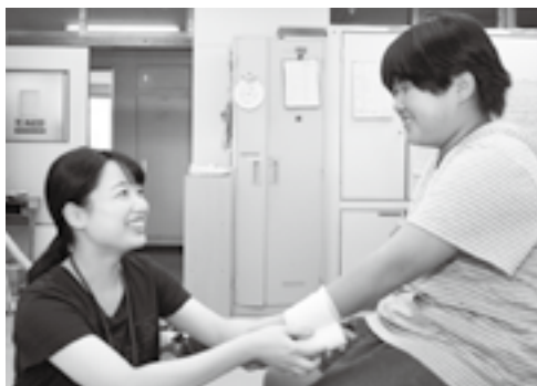
笑顔で子どもを安心に

保健室は、けがをしたり、体調 を崩したりした子どもたちが時間 を問わず訪れるだけでなく、さま ざまな悩みを抱える子どもたちが 訪れる場所でもあります。