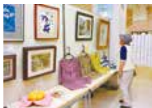
自信作が勢ぞろい

期間=8月23日(木)~29日(水) 会場=赤坂ふれあいセンター 内容=書・絵画・彫刻・写真・手工芸・短歌・俳句・川柳などの展示 ※入場は無料です。鑑賞を希望する人は当日直接会場へ。くわしくは同センター(☎26-0236)へ。