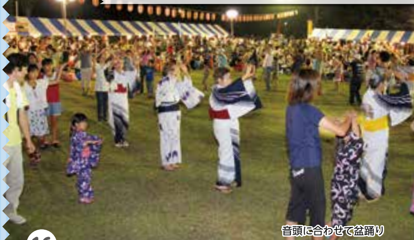
音頭に合わせて盆踊り