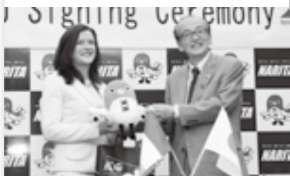
調印式で記念品を贈呈(16日)