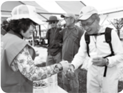
冷やしトマトに思わず笑顔

空港周辺や緑豊かな里山などのコースを歩く「成田エアポートツーデーマーチ」。このイベントが2日間にわたって開催され、県内外から延べ2,037人が参加しました。参加者は風景の写真を撮ったり、家族や友人同士で会話をしたりしながら初夏の自然の中をウォーキング。休憩所では冷やしトマト、ゴールでは市内で採れたクリームスイカのもてなしがあり、喉を潤しました。印旛沼周辺を巡った芝山町在住の親子は「スカイアクセス線の近くは車でよく通るけれど、歩くと風景が違って見えて新鮮です」と話していました。