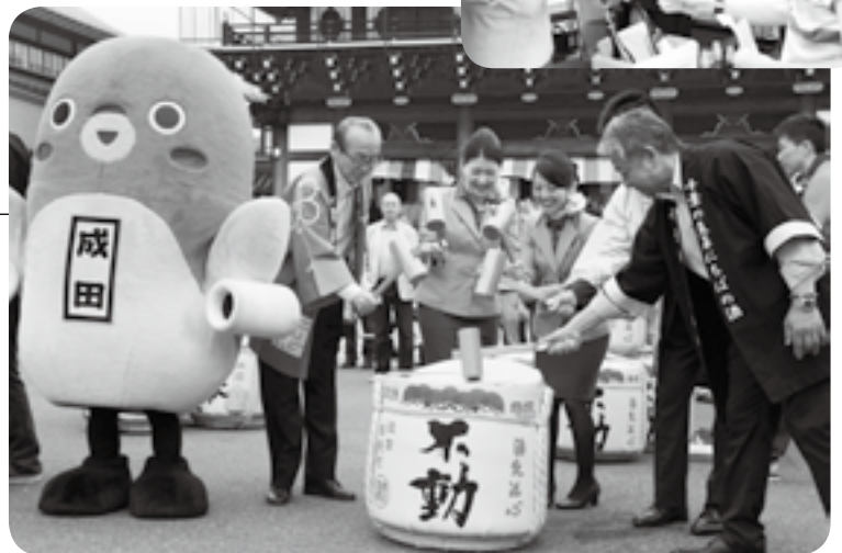
開会前には鏡開きも

市内や近隣市町などの酒を味わえる「NARITA酒フェスティバル御開帳」が成田山総門前広場で開催されました。会場には、酒の物販のほか、一杯100円からの試飲があり、何種類もの銘柄を飲み比べ、顔を赤らめる人の姿も。御開帳特別デザインのうなりくんグラスを購入した参加者は「去年に続いて参加した。このグラスでいろいろなお酒を味わいたい」とイベントを満喫していました。