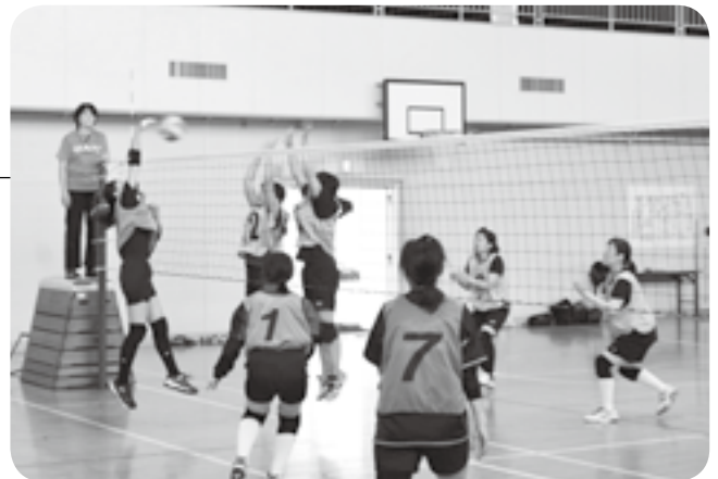
実戦さながらの試合練習

バレーボールの魅力を知ってもらおうと「9人制バレーボール教室」が中郷運動施設で行われ、47人が参加しました。9人制バレーボールは6人制と比べ、ラリーが続きやすく粘り強いゲームが楽しめることが特徴。参加者は先生からの説明を受けながら、トスやレシーブなどの基礎練習や試合形式の練習に熱心に取り組んでいました。