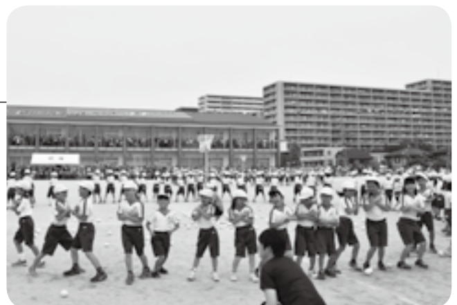
音楽が流れたらダンス開始

市内の一部の小学校で運動会が開催されました。公津の杜小学校では、道具を使って昆虫になりきりながらゴールを目指す個人走や、音楽に合わせてダンスをした後に玉入れをするダンシング玉入れなど、個性豊かな競技が行われました。どの競技にも一生懸命に取り組む子どもたちの姿に、観客席からはたくさんの声援が送られ、会場は大いに盛り上がっていました。