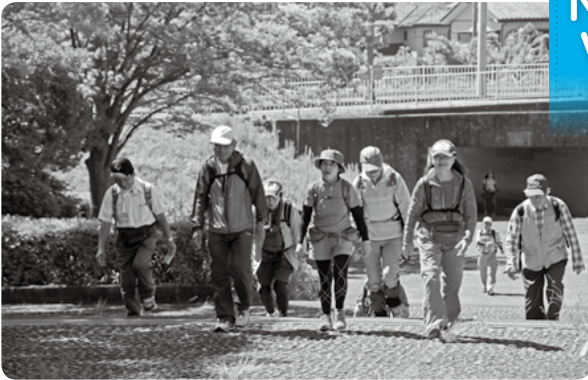
新緑が鮮やかな公園内をウォーキング