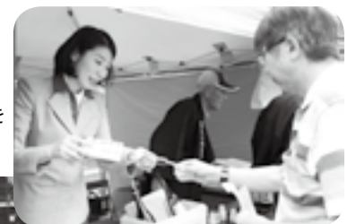
気になる銘柄を試飲

空港周辺や緑豊かな里山などのコースを歩く「成田エアポートツーデーマーチ」。このイベントが2日間にわたって開催され、県内外から延べ2,037人が参加しました。参加者は風景の写真を撮ったり、家族や友人同士で会話をしたりしながら初夏の自然の中をウォーキング。休憩所では冷やしトマト、ゴールでは市内で採れたクリームスイカのもてなしがあり、喉を潤しました。印旛沼周辺を巡った芝山町在住の親子は「スカイアクセス線の近くは車でよく通るけれど、歩くと風景が違って見えて新鮮です」と話していました。