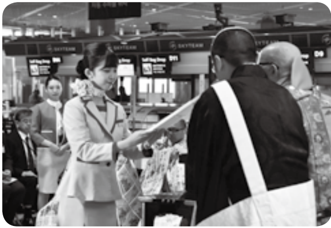
御護摩札を受け取る客室乗務員