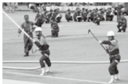
訓練で培った技術を披露