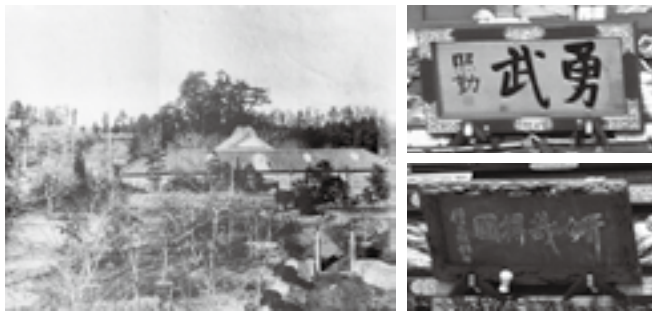
右上/本町の山車の額「武勇」 右下/仲之町の山車の額「妍哉得國」 左/設立当時の成田幼稚園(『成田の歴史アルバム』より)