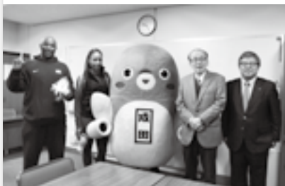
コーチ・アスリートと共に(21日)