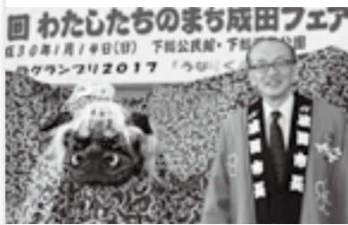
西大須賀の獅子舞と(14日)