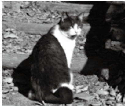
無責任に捨てないで

捨てられて保護された犬・猫は、引き取る人がいないと殺処分されます。県動物愛護センターでは、殺処分を少しでも減らすため、