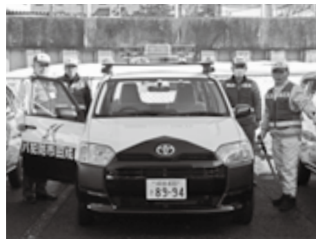
パトロールへ出発

市では、不法投棄監視員や環境保全指導員などによる巡回・夜間パトロール、監視カメラの設置を行っています。しかし、道路脇や個人の土地への不法投棄が後を絶ちません。発見したときは速やかに環境対策課(☎20・1532)へ連絡してください。 不法投棄は管理の行き届いていない場所で発生する傾向があります。土地の所有者や管理者は不法投棄されないよう、定期的な見回り、草刈りなどに努めてください。