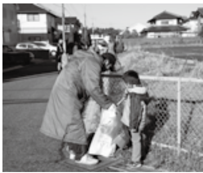
地域をきれいにしよう