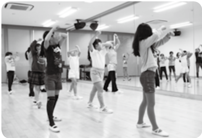
動きを鏡でチェック