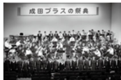
若さあふれる演奏を楽しんで

※入場は無料です。鑑賞を希望する人は当日直接会場へ。くわしくは国際文化会館(☎23-1331、月曜日、祝日の翌日は休館)へ。