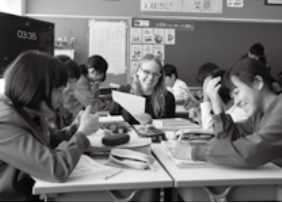
グループ内で英語で会話(中台中・2年)