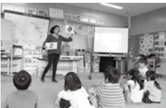
イラストを見て英語で答えよう(前林小・1年)