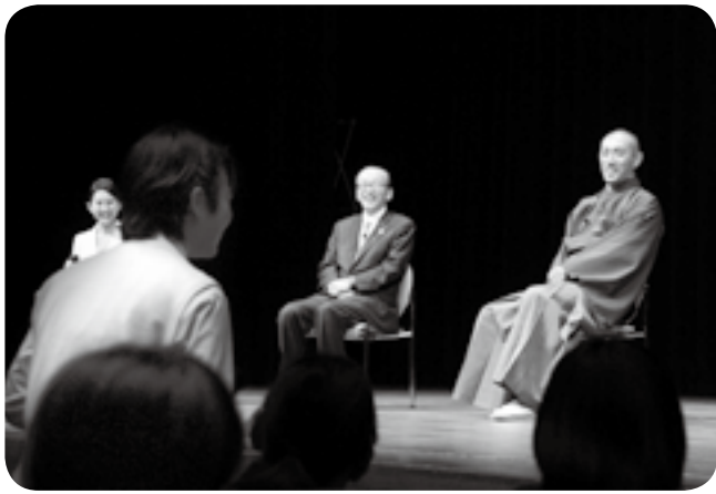
質問に冗談を交えて答える海老蔵さん