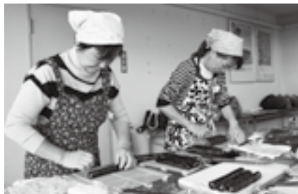
初めての人も挑戦してみよう