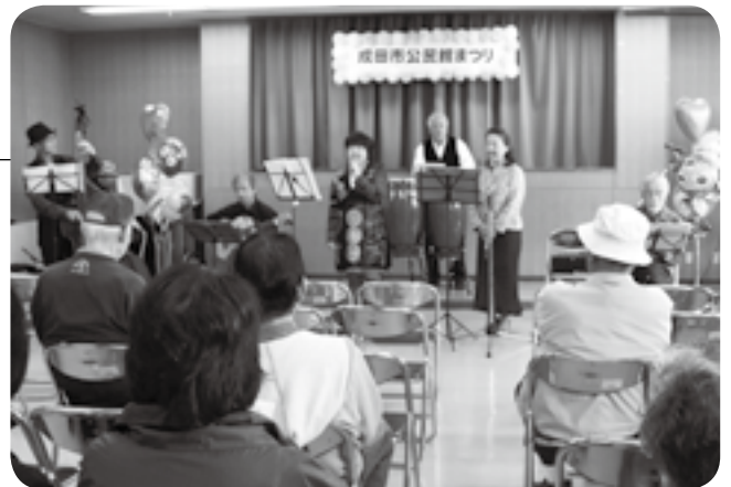
観客を前に演奏を披露

市内13カ所の公民館で活動するサークルが、日頃の活動の成果を披露する「公民館まつり」が中央公民館で開催されました。今回参加した団体はおよそ200。写真や絵手紙、手工芸品などの展示のほか、ダンスや楽器演奏の発表が行われました。また、手打ちそばなどの飲食物や陶芸・手工芸品の販売ブースも立ち並び、訪れた人は思い思いに会場を巡り、見たり、聴いたり、味わったりと楽しんでいました。