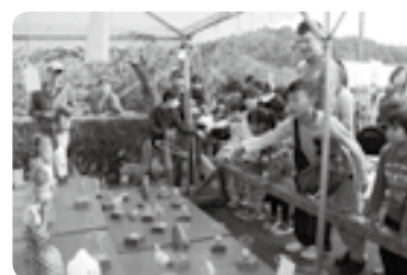
さまざまな催し物を楽しもう

会場の駐車場は大変混雑します。車で来場する場合は臨時駐車場を利用してください。会場と臨時駐