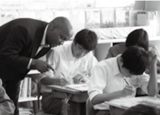
アドバイスも英語で(中台中・3年)