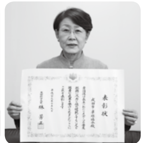
文部科学大臣表彰・成田市卓球協会(会長・関山さん)