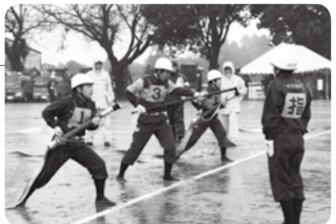
雨の中訓練の成果を披露