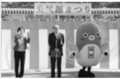
公民館まつりであいさつ(27日)