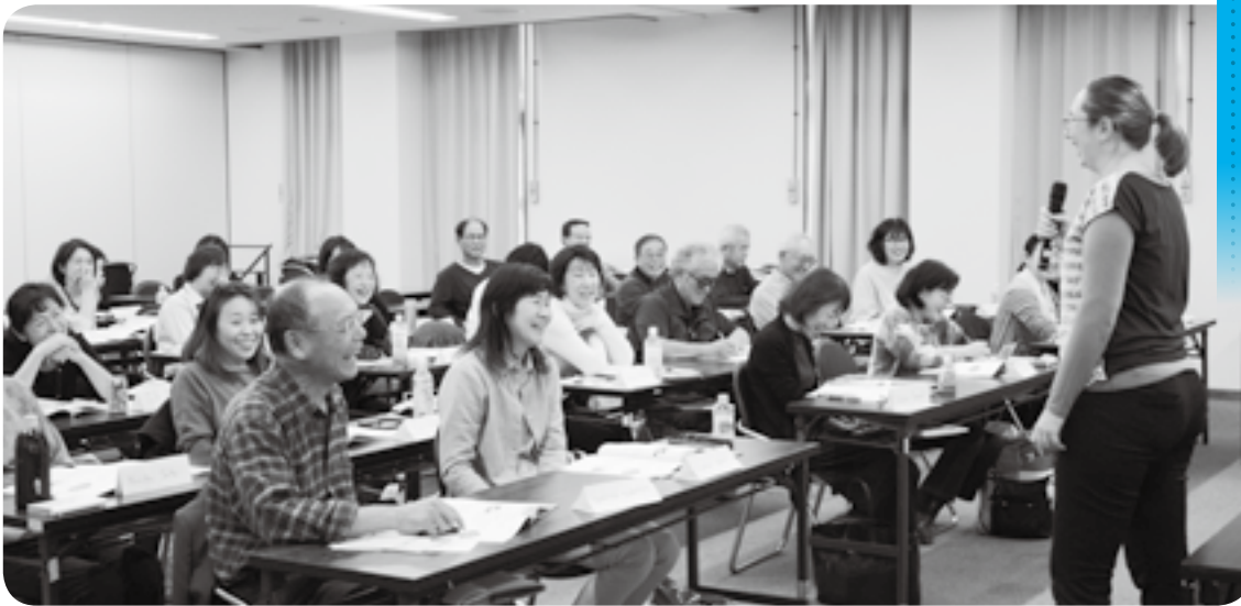
カナダ出身の講師が英語で講義