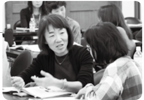
身ぶりを使って説明

東京2020オリンピック・パラリンピック競技大会に向けて、街中で困っている外国人に簡単な英語で対応できるボランティアを育成する「外国人おもてなし語学ボランティア育成講座」が市体育館会議室で行われました。講義では、体調不良やなくし物で困っている外国人への対応や、日本文化とそのマナーの伝え方などを練習しました。参加者は「今までは外国人がいても話し掛けられなかったが、これをきっかけに困っているのを見たら、「Are you OK?」と積極的に声を掛けたい」と話していました。