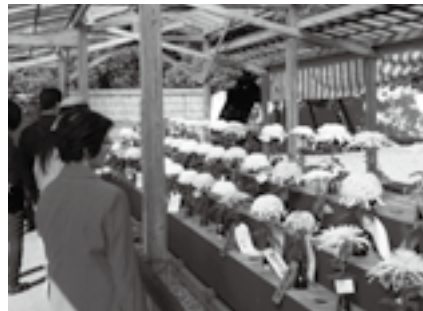
さまざまな菊花が並ぶ