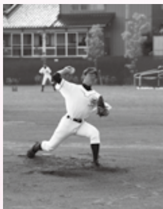
実戦を想定した投球練習

の良さはどこにも負けません。その成果として、印旛郡市新人野球大会では3位になり、県大会に出場しました。7月にある印旛郡市の総体では、今度は優勝して県大会に進むことが目標です。