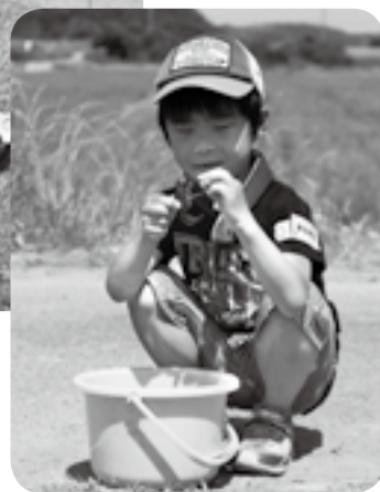
大きいのが釣れたね