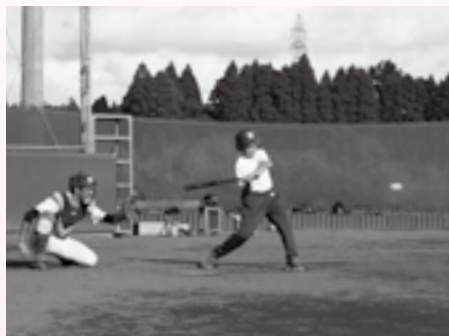
5・6年生も練習に参加

練習では、自分たちに足りないところを補強するように、メニューを部員たちで考えています。