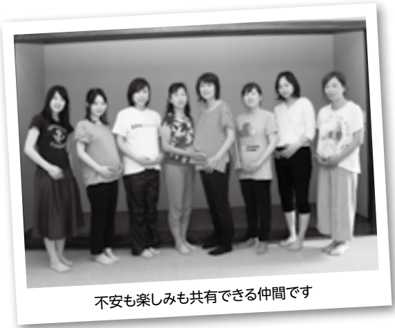
不安も楽しみも共有できる仲間です

腰をひねり前屈する「三角のポーズ」。妊娠中に多い腰痛や肩凝り、便秘を予防・改善することができます。ほかにも、緊張をほぐし陣痛をスムーズにする脚の付け根のストレッチや、母乳の出を良くする肘回しを行いました。