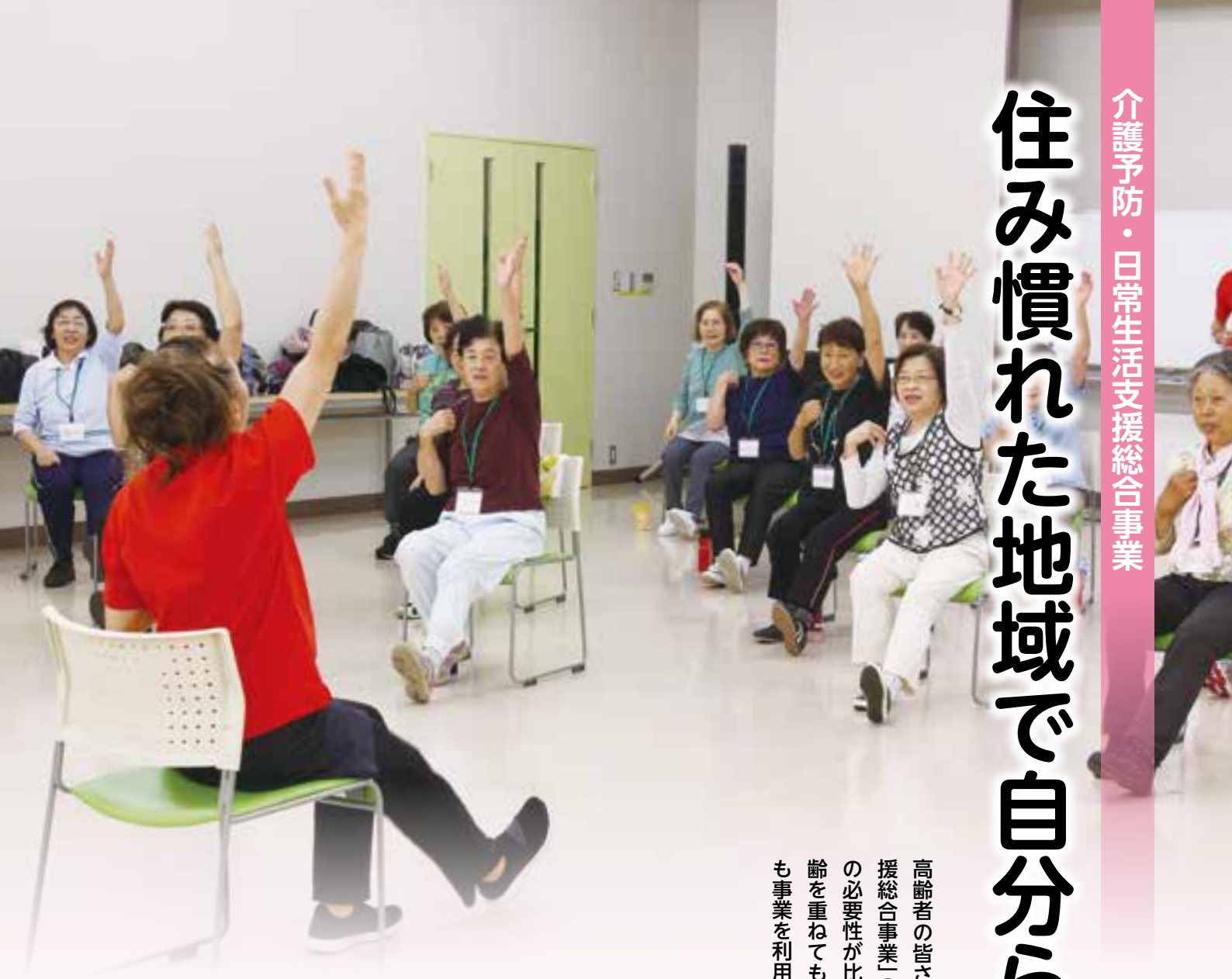
講師の動きをまねて体操(まるごと元気教室)

○介護予防・生活支援サービス事業：介護保険の要支援認定を受けた人や、日常生活に必要な体の機能の状態を知ることができ「基本チェックリスト」により生活機能の低下が見られる人 ○一般介護予防事業：65歳以上の全ての人