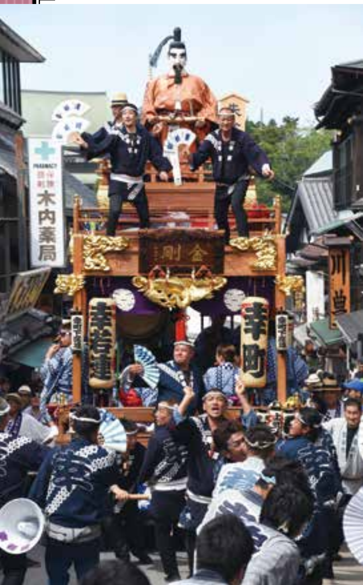
仲町の坂を上げる幸町の山車

お囃子と踊りの競演が始まります。御輿が街中に繰り出すと、山車・屋台が各町内を午後10時まで曳き廻されます。 駅前道口駅前広場でお囃子と踊りの競演が始まります。この日も午後10時まで、山車・屋台が各町内を曳き廻されます。