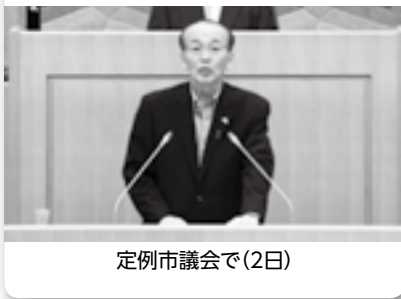
定例会市議会で(2日)