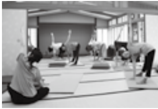
無理のない体勢で「三角のポーズ」