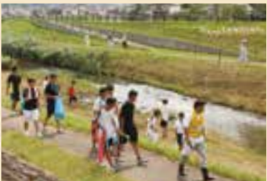
河原を歩いてごみ拾い

7月は河川愛護月間です。美しい水辺をつくるため河川の清掃にご協力ください。 日時=7月26日(水) 午後1時30分から(雨天の場合は中止) 集合場所=根木名川河川敷(市営東和田駐車場横) コース=根木名川白鷺橋~関戸橋(約3km) ※くわしくは県成田土木事務所(☎26-3631)または土木課(☎20-1550)へ。