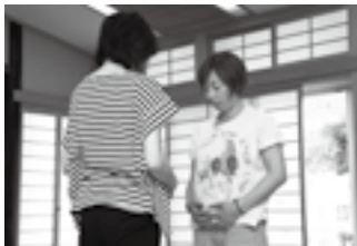
赤ちゃんに届けるように呼吸

運動不足だと体力がなくなり、出産後に疲れやすくなるため、妊娠中にできる体づくりを教わっています。この日取り組んだのは、四つんばいで背中を丸める「猫のポーズ」や、立って