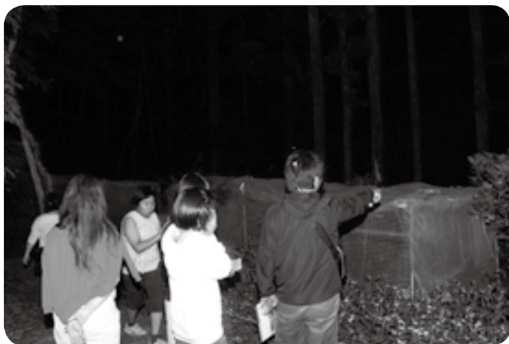
向こうにホタルがいる

んでくると次々と釣り上げて、満足そうな笑みを浮かべていました。釣りが終わった後は、下方地区の人が用意してくれた、ゆでたえびがにを試食。初めて食べたという子どもたちは「エビみたいでおいしい」と言いながらたくさん食べていました。