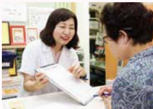
薬局で気軽に健康チェック

予防に取り組めるプログラムを用意しています。 くわしい日程は高齢者福祉課(☎20・1537)へ問い合わせください。 なりたいきいき100歳体操 手首や足首に重りを付けて、椅子に座り、ゆっくりしたりリズムの音楽に合わせて行う体操です。転倒予防のほか、立ち上がるのが楽になるといった効果が期待できます。