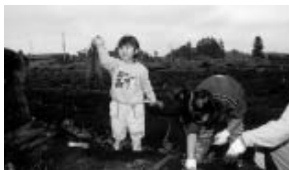
大きいおイモがとれたよ

申し込み方法 = 9月10日(金)までに、ハガキ(1家族1通)に住所・氏名・電話番号・人数4人までを書いて農政課(☎286-8585 花崎町760)へ。くわしくは同課 ☎20-1542 へ。