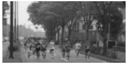
成田の秋を駆け抜けて

出場者 日時 = 11月7日(日)午前10時スタート(雨天決行) 会場 = 市陸上競技場(スタート・フィニッシュ) 種目(いずれも男女、市民の部あり) ○一般...3km・10km・ハーフマラソン ○小・中学生...3km 参加費 = 一般3,000円、中学生1,500円、小学生1,000円 申込期限 = 郵便・インターネット...9月30日(木) 運営ボランティア 日時 = 11月7日(日)午前8時~正午 場所 = ニュータウン内走路 内容 = 走路の監察・選手の安全確保 対象 = 高校生以上 出場申込書は、市役所・市体育館・陸上競技場・公民館・市立図書館に置いてあります。くわしくは大会事務局(生涯スポーツ課・☎20-1584)へ。