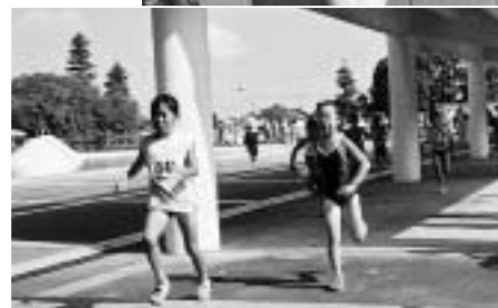
スイムの後、バイクに向かう小さな鉄人たち

連日の猛暑となった8月8日、中台運動公園を会場に、第3回キッズ&ジュニアトライアスロン大会が開催されました。大会には過去最高の98人が参加。中台ブルでのスイムの後、バイク、ランに向かう小さな鉄人たちが、炎天下のコースを力強く駆け抜けて行きました。