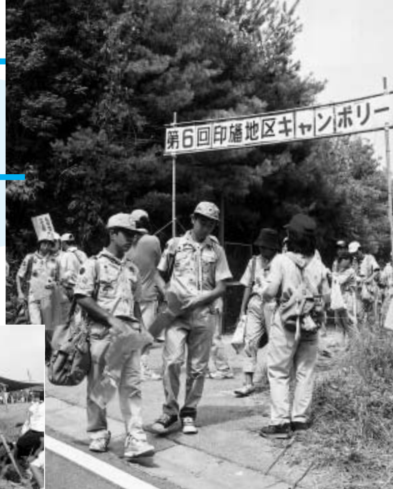
地区内の清掃に出発