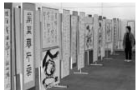
自慢の作品が並びます

申し込みは9月22日(水)までに、往復ハガキに出品を希望する催し物名・住所・氏名・年齢・職業・電話番号を書いて生涯学習課(〒286-8585 花崎町760・☎20-1583)へ。