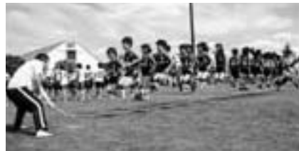
みんなの力で新記録

期日=10月3日(日) 会場=市陸上競技場 種目などについては区・自治会・町内会へ回覧板でお知らせします。参加申し込みは、一緒に回覧する申込書に記入してください。また、参加賞も多数用意していますので奮ってご参加ください。くわしくは生涯スポーツ課(☎20-1584)へ。