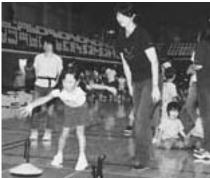
狙いを定めてストーンを滑らす(ユニカール)

日時=9月19日(日)午前9時30分~正午 会場=市体育館アリーナ 実施種目=ユニカール・インディアカ・フ ォークダンス・バタンク・バウンドテニ ス・ピンボウリング・輪投げなど 参加費=無料 参加を希望する人は当日直接会場へ お越しください。くわしくは生涯ス ポーツ課(☎20-1584)へ。