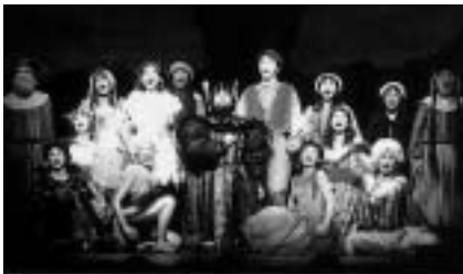
心に響く歌声とともに

前売り所 = 国際文化会館、ヨネダカメラ店、ボンベルタ成田店4階・ジャスコ成田店1階・イオン成田SC2階の各サービスカウンター、JAL生活協同組合成田地区売店 くわしくは(財)成田市教育文化振興財団 ☎23-1331 へ。