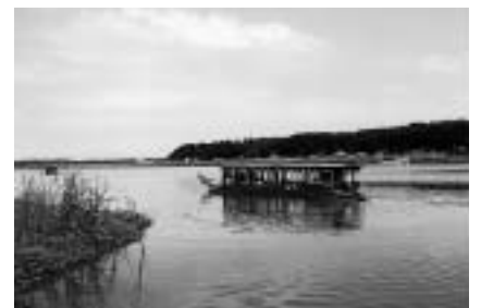
豊かな自然を感じてみよう

申し込み方法 = 7月15日(木)の必着までに、往復ハガキ1枚に2人までに希望乗船時間(第2希望まで記入)・住所・氏名・年齢・電話番号を書いて(財)印旛沼環境基金(☎285-8533 佐倉市宮小路12)へ。 くわしくは同基金(☎043-485-0397)へ。