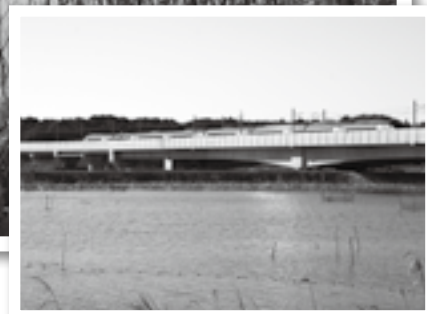
堤防から見るスカイアクセス線