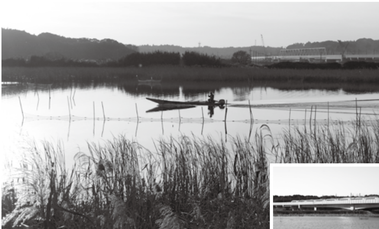
印旛沼を渡る漁船

豊かな自然、歴史ある寺社や街並み、国際空港など、多様な景色・眺め(景観)が楽しめる成田市。市では「成田らしさを感じられ、良好な景観を望める場所」を市民共有の宝物として保全・活用しようと、「なりた景観資産」として登録しています。ここでは、市民の皆さんから推薦され登録された、景観資産の数々を紹介します。