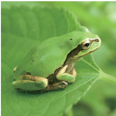
6. ニホンアマガエル