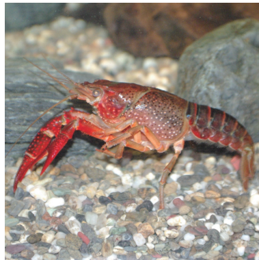
7. アメリカザリガニ