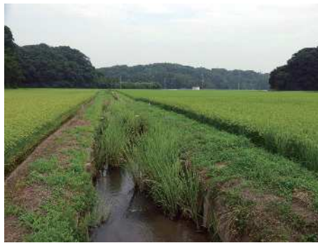
じょうこうがわ 浄向川のようす