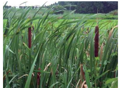
ほ なかま 穂をつけたガマの仲間