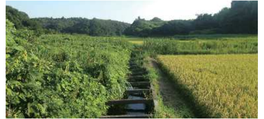
てんしょうじがわ 天昌寺川のようす