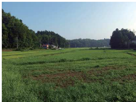
田んぼのまわりに広がる畑