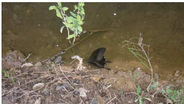
水をすうモンキアゲハ