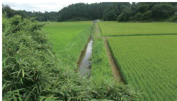
派川根木名川のようす