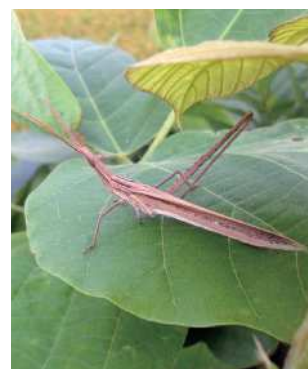
ショウリョウバッタ