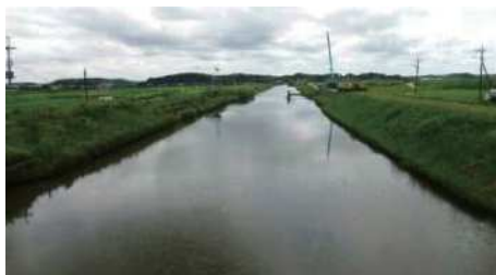
ゆったりと流れる根木名川