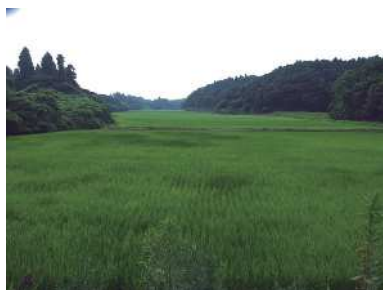
細長くつながっている谷津田