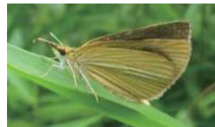
ギンイチモンジセセリ