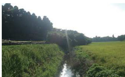
尾羽根川に沿って広がる田んぼ