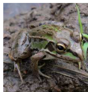
トウキョウダルマガエル