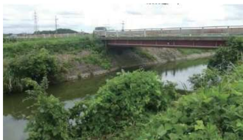
つる植物が川沿いに広がっている