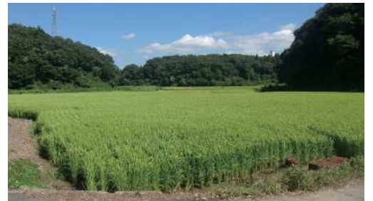
スギ林にかこまれた田んぼ