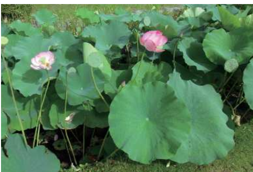
いずみ聖地公園のハス