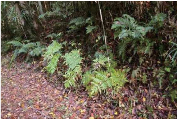
シダの仲間が多い