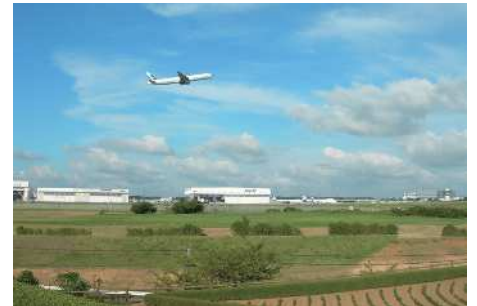
日本の空の表玄関「成田国際空港」