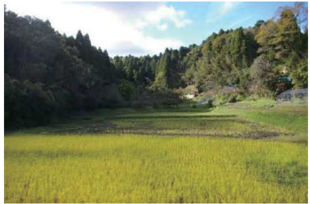
久米地区の谷津田