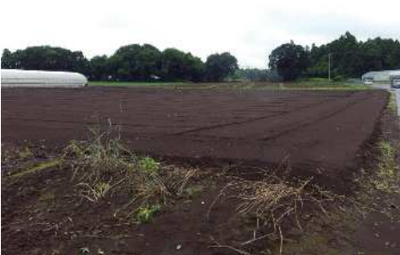
空港のまわりにある畑