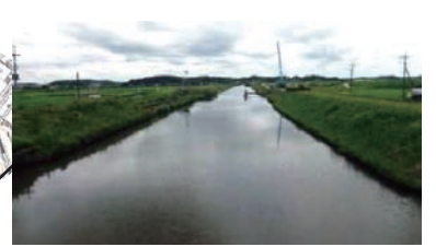
ゆったりと流れる根木名川