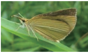
ギンイチモンジセセリ

水辺を好むトンボの仲間やギンイチモンジセセリなどのチョウの仲間が見られるほか、草地にすむバッタの仲間も多く見られます。また、ヨシに止まって鳴いているニホンアマガエルのほか、水面に顔を出して鳴いている特定外来生物のウシガエルがよく見られます。水辺を好むサギやカモの仲間、スズメやムクドリ、ホオジロの仲間など草地を餌場などに利用する鳥類が多く見られ、水田や周辺の水路、畦道などで餌を採る姿を見ることができます。また、畦ではモグラ塚も多く見られます。