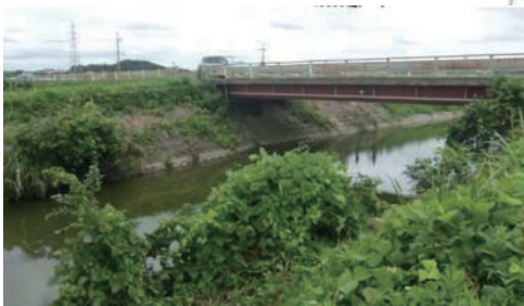
締切橋周辺の川沿いは、ツル植物のクズが生い茂る