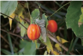
カラスウリが多い