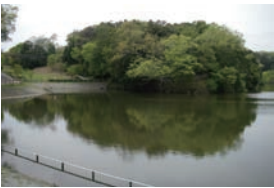
坂田ヶ池総合公園 (トイレ、駐車場あり)