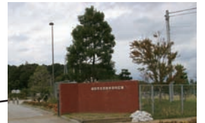
北羽鳥多目的広場 (トイレ、駐車場あり)