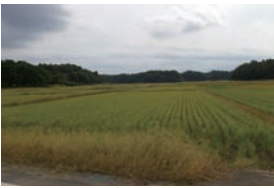
やっただ谷津田が広がる

り、モンシロチョウやタマムシなどの昆虫類が見られます。水辺が比較的少ない地域ですが、ニホンアマガエルなどのカエルの仲間も見られます。ツグミやムクドリといった畑地や草地を餌場などに利用する鳥類が多く見られます。樹林地ではコゲラやシジュウカラなどが群れで移動している姿を見ることができます。畑地や畦 あぜ ではモグラ塚も見られます。