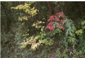
秋には色鮮やかな紅葉も