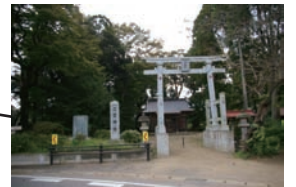
二宮神社 (トイレ、駐車場あり)

この地図は、国土地理院の電子地図25000『成田』、『下総滑川』を使用したものである。