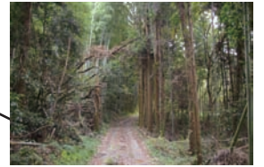
うつそふ鬱蒼とした林内の道