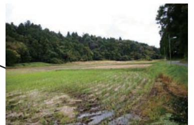
市街地に残された谷津田と斜面林