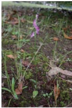
敷地内に咲くネジバナ 成田市役所 (トイレ、駐車場あり)

ほとんどがコンクリートやアスファルトで覆われていますが、一部地域では緑が多い住宅地や社寺林が広がっています。根木名川沿いには、ヨシ、マコモなどが生育しており、水田周辺には水田雑草群落広がっています。