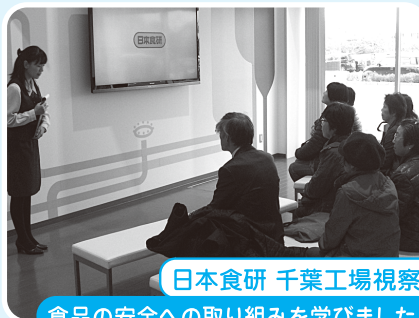
日本食研 千葉工場視察 食品の安全への取り組みを学びました。