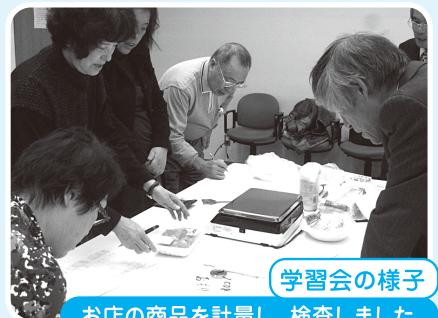
学習会の様子 お店の商品を計量し、検査しました。

消費生活モニターは、悪質商法をはじめとした様々な消費生活に関する講義や意見交換などの学習会のほか、私たちが日頃使っている商品の製造工場の視察などを通じて勉強しています。そして、活動で学んだ知識や情報を活かし、市民に周知し啓発するなど日々活躍しています。