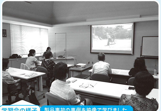
学習会の様子 製品事故の事例を映像で学びました。