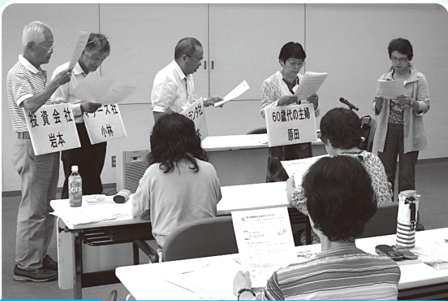
学習会の様子 疑似体験により、悪質業者の手口を知りました。