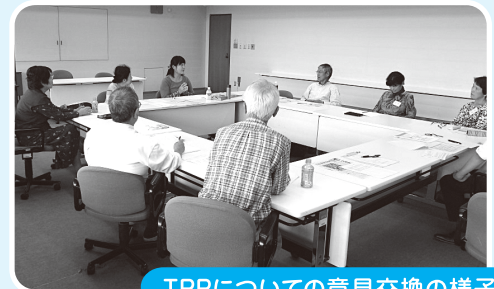
TPPについての意見交換の様子

消費生活モニターは、消費生活に関する学習会や意見交換を中心とするモニター会議(毎月1回程度)や工場視察などに参加し、かっこいい消費者になることを目指すものです。また、地域の消費者のリーダーとして、得た知識や情報を広く啓発することも重要な役目です。