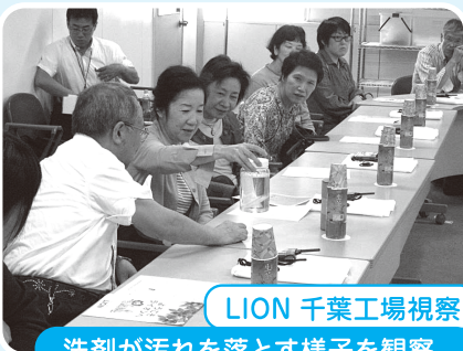
LION 千葉工場視察 洗剤が汚れを落とす様子を観察。