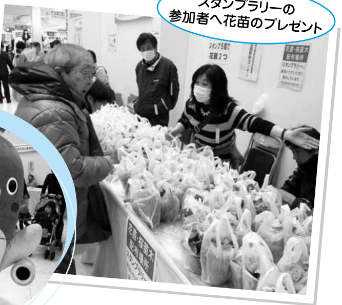
スタンプラリーの参加者へ花苗のプレゼント

今回は「正しい知識を深めよう!～賢い消費者をめざして～」をテーマに、暮らしに役立つ情報を展示、紹介し、来場された方々を迎えました。また、昨年度に引き続き、クイズに答えてスタンプを集めるスタンプラリーを行い、多くの方にご参加いただきました。