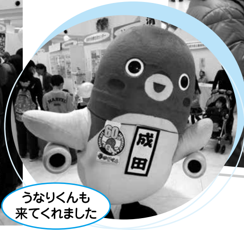
うなりくんも来てくれました