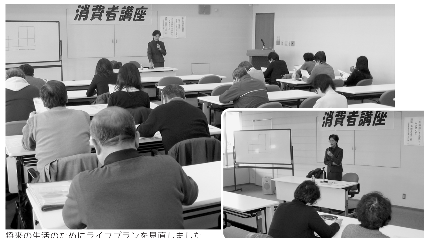
将来の生活のためにライフプランを見直しました