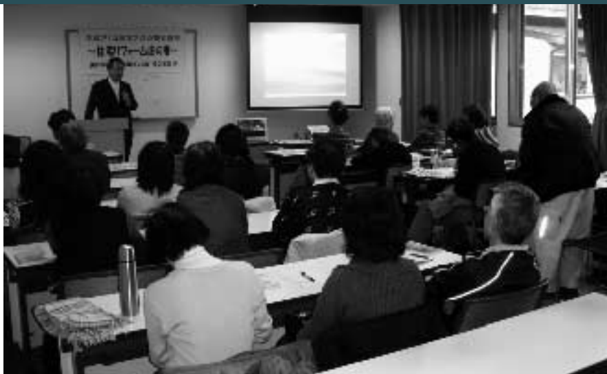
リフォームに関する疑問にアドバイス