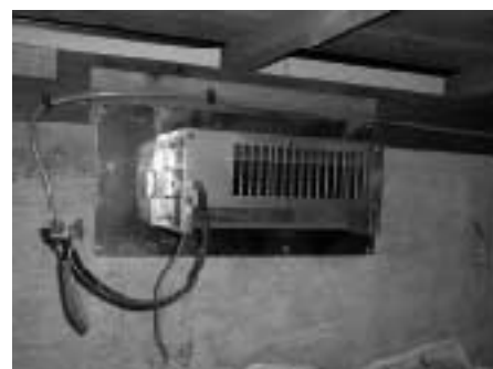
換気扇を付けて逆に床下の通気が悪くなることも