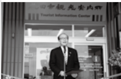
セレモニーであいさつ(20日)