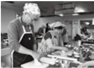
生地を繰り返し丸める