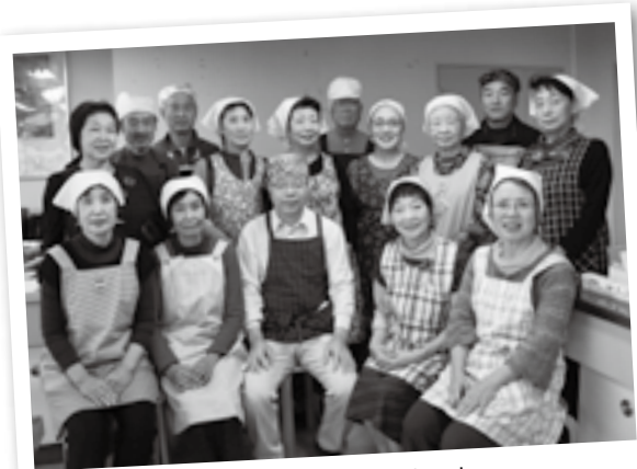
今でも仲の良い同期生です

水温、手ごねの三つ。特に、強力粉に混ぜる水は調理場所の室温に合わせて温度調節するなど、気を使います。手ごねは20分続けて行うので疲れますが、手で伸ばしたときに生地が透けるまでこねると、しっとりとした食感になります。