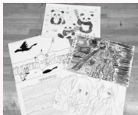
出来上がった作品の数々

3学期もクラブ活動は続きます。今度はどんなイラストにしようか、今から楽しみます。