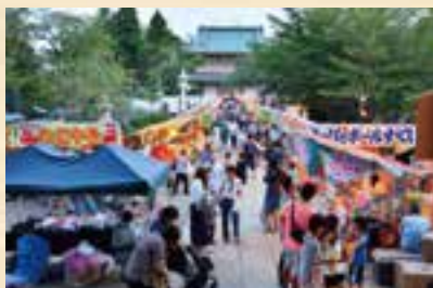
さまざまな露店が並び