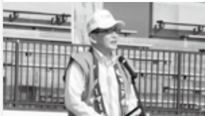
ツーデーマーチであいさつ(21日)