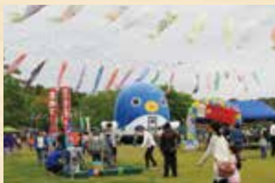
たくさんのおこいのぼりがお出迎え

日時=5月4日(水・祝)(雨天の場合は5日(木・祝)) 午前9時から 会場=公津の杜公園 内容=ステージ発表、模擬店、遊びのコーナー、消火器体験など ※くわしくは公津みらいまつり事務局(☎070-6960-8310)へ。