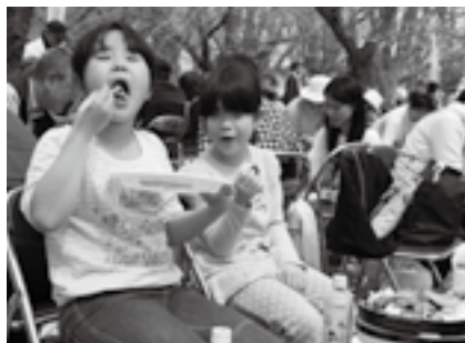
大きな口でパクリ

※各組1台分の駐車場が確保されます。くわしくは空の駅さくら館(☎33-3309)へ。