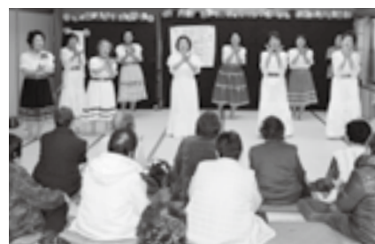
優雅な踊りを披露