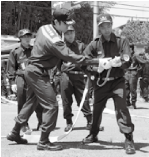
新入団員の知識や技術の向上を図る(消防団夏季訓練)