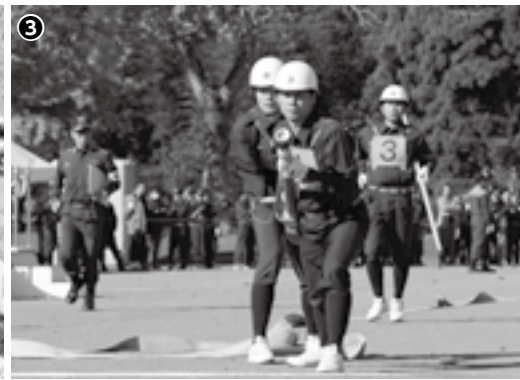
①規律正しい部隊行進(消防出初め式) ②堤防決壊の対処法を実践(水防演習) ③訓練の成果を競う(消防操法大会)

近年、全国で風水害・地震などの大規模災害が多発し、地域防災の要である消防団の必要性が高まっています。特に、地域に密着した消防団員の活動は、災害に強い安全なまちづくりの実現に欠かせません。