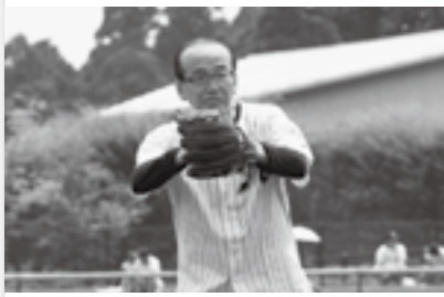
プロ野球公式戦で始球式(25日)