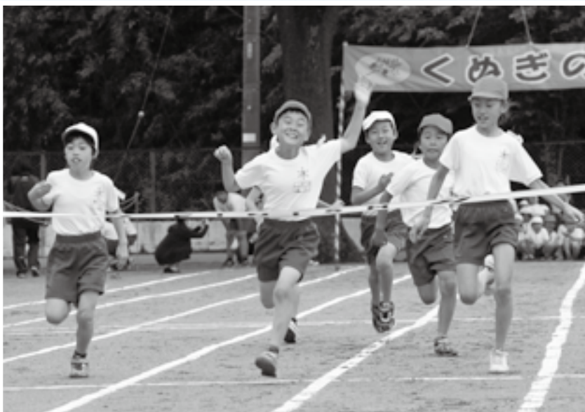
やったー1位だ(津富浦小学校)