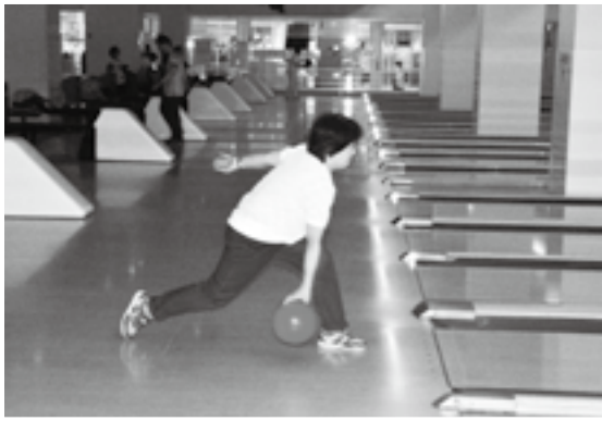
歩数を合わせてゆっくりと