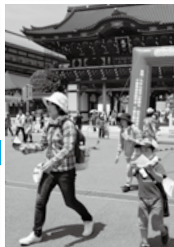
ゴールして配られたスイカは格別