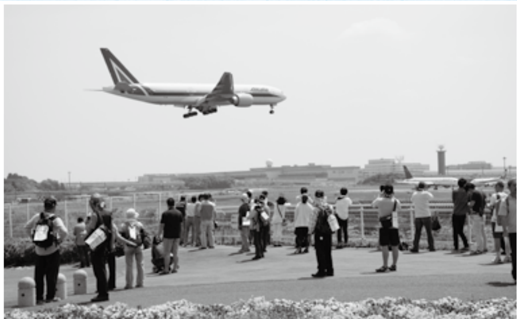
さくらの山から望む 迫力ある飛行機