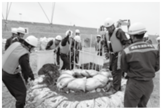
堤防の漏水には「釜段工法」で対処

「台風による豪雨で、利根川が氾濫危険水位を上回る見込み」との想定で5月23日、竜台地先の利根川堤防で「水防演習」が行われました。会場には成田市消防本部や消防団、陸上自衛隊など20機関・約900人が集まりました。土のうを積んだり、堤防の決壊を防いだりする訓練のほか、消防本部と自衛隊の合同による水難救助訓練が実施されました。これから梅雨を迎え、台風による増水も懸念されることから、参加者は相互の連携を再確認しました。