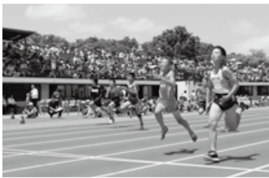
期待と声援を一身に受けて疾走

成田空港周辺や田園地帯を歩いて巡る「成田エアポートツーデーマーチ」が5月16日・17日の2日間にわたって開催されました。子どもから大人まで延べ2,088人の参加者は、それぞれの体力や回りたい場所に合わせて7・10・20・30kmのコースを選択。中台運動公園をスタートすると、間近に見える飛行機や初夏の新緑を楽しみながらゴールの成田山新勝寺を目指しました。