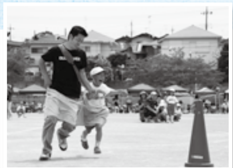
親子で息を合わせて(神宮寺小学校)