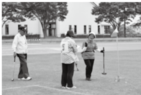
ボールが入ってにっこり

成田市・富里市・八街市・酒々井町・芝山町から選手が集まって「3市2町グラウンド・ゴルフ大会」が5月28日、中台運動公園陸上競技場で行われました。大会では、192人の参加者が32チームに分かれて、32ホールを回り、その合計打数を競いました。参加者は穴の代わりになるホールポストに少ない打数でボールを入れようと、真剣な面持ちで取り組んでいました。