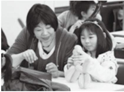
かわいい犬ができるかな

日時=2月28日(土) 午後1時~3時30分 会場=国際文化会館 講師=★MIHARU★さん(バルーンパフォーマンス) 対象=12歳以下の子どもと保護者(小学生は1人でも参加可) 定員=16組(先着順。保護者1人につき子ども2人まで) 参加費(1組当たり)=2,500円(材料費など) ※申し込みは国際文化会館(☎23-1331、月曜日、祝日の翌日は休館)へ。