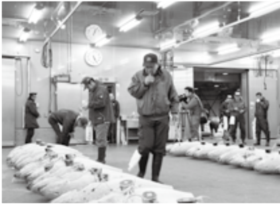
初競りを前にマグロの品定め