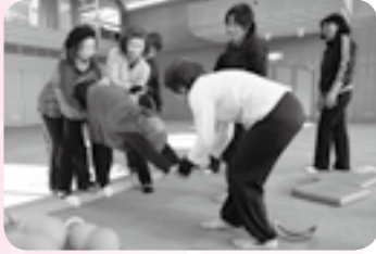
上半身を曲げずに腰から倒す

トレーニングのメニューは、健康運動指導士の資格を持つ先生が考えます。時にはバランスボールなどの運動器具も使います。トレーニング中先生は、体の動かし方や姿勢、力を入れる部分、呼吸の仕方などを分かりやすく指導してください。また、一人一人を見て回り、それぞれの体力や筋力に合わせてより効果的で、無理をして体を壊すことがないように指導してください。安心してトレーニングに打ち込むことができます。