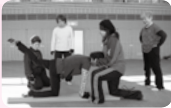
背筋を真っすぐに保って