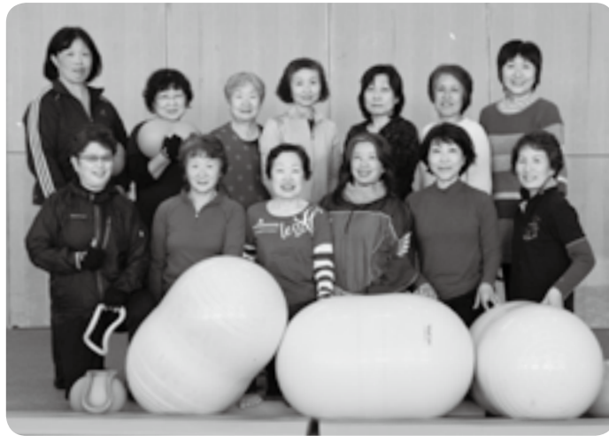
トレーニング器具を前にして

体幹を鍛えることで、膝や腰の痛みが消えた、代謝がよくなり痩せた、冷え症が解消された、家事をしても疲れにくくなったなど、メンバーの間でさまざまな効果が表れています。効果を実感したり、効果が表れた話を聞いたりして、トレーニングを続ける励みにしています。激しい動きをするわけではないので、もともと体を動かす習慣がない人でも大丈夫。わたしたちと一緒に心地よい汗を流しませんか。