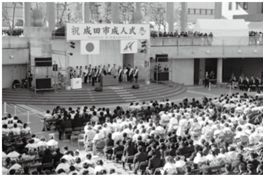
式には約950人の 新成人が出席