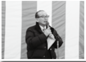
開市式であいさつ(5日)