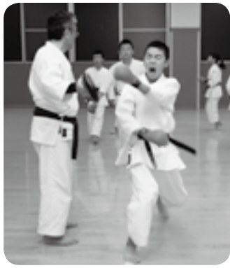
突きは弾むように打つ