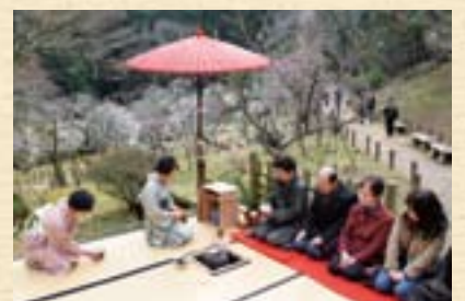
表千家による野だて

期間=2月21日(土)~3月8日(日) イベント日時=期間中の土・日曜日 午前10時~午後3時 会場=成田山公園 内容=甘酒のサービス(無料)、投句・写真コンテスト、西洋庭園での箏演奏、野だて(無料)など ※くわしくは成田市観光協会(☎22-2102)へ。