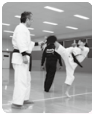
顔の高さまで蹴りの練習