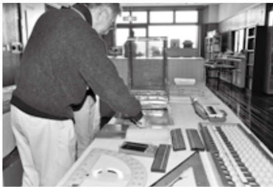
分度器や定規なども展示