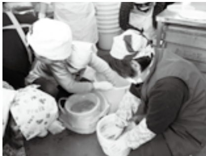
しっかり空気を抜くのがみそです

申込方法 =2月6日(金)(必着)までに、はがきまたはEメールで住所・氏名・電話番号・午前または午後の希望を農政課(〒286-8585 花崎町760 Eメール nosei@city.narita.chiba.jp)へ ※くわしくは同課(☎20-1542)へ。