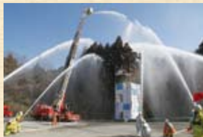
消防隊による一斉放水

日時=2月8日(日) 午前10時から 会場=国際文化会館駐車場(雨天時は式典のみ実施) 内容=消防隊の訓練、音楽隊の演奏、成田高校附属小学校ダンスクラブの演技など ※見学を希望する人はイオンモール成田の駐車場を利用してください。くわしくは消防総務課(☎20-1590)へ。