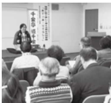
講座は年5回行われます