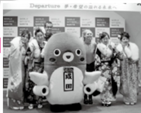
外国人観光客と一緒に記念撮影

成人の日を翌日に控えた1月11日、成田空港で「成人式」が行われました。成田空港での開催はことしで2回目で、市内の新成人は男性671人、女性657人の合わせて1,328人です。式典では航空会社5社の客室乗務員や整備士らが、祝福の言葉を述べたり、新成人との記念撮影に応じたりしました。新成人は、家族や恩師などに見守られながら、人生の節目を迎えました。