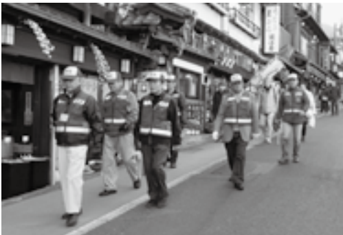
地域の安全を守ります

市では、市内の防犯パトロールに参加し、地域の防犯活動に取り組む地域防犯推進員を募集します。 応募資格 市内在住で、市の防犯パトロールへの参加を通じて得た知識・経験を生かし、地域における防犯活動に取り組む意欲のある20歳以上の人