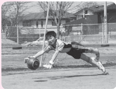
ゴールは許さない

結成してまだ4年の若いチームですが、着実に力を付けています。4年生は、市内外から40チームが参加してことしの1、3月に行われた大会で優勝しました。ほかの学年もこれに刺激を受け、チーム全体に勢いがあります。これからも積極的にプレーする気持ちを忘れず、1つでも多く勝てるように頑張ります。