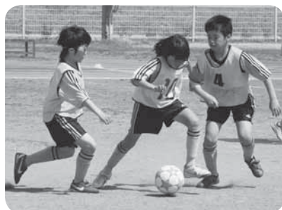
ディフェンスの間をドリブル突破