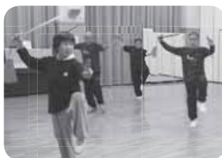
先生の動きをよく見て