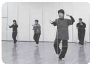
手足をゆっくりと伸ばしていく