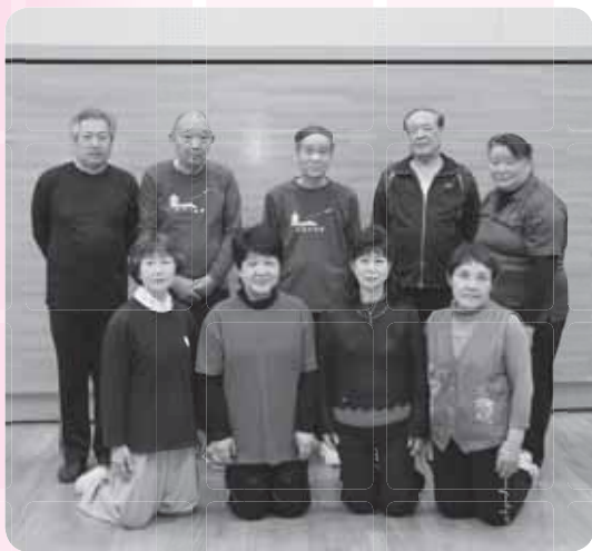
ゆったりと優雅な動きを目指しています

活動日には10人前後が集まって、「簡化24式」という基本の動きを練習します。武術の一種である太極拳は、敵の攻撃をかかわす動きや蹴る動きなど、一つ一つの動作に意味があります。先生にこれらの意味を教わりながら、一連の動