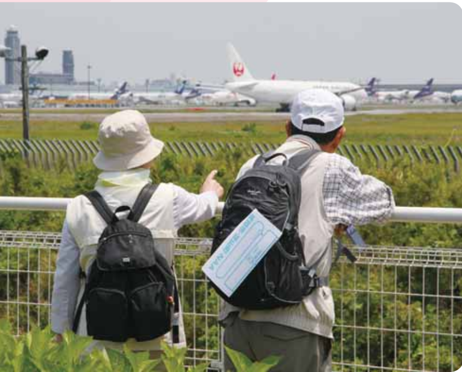
飛行機を見ながら一休み

芝山町に在住の人以外は1、500円) ○当日申し込み…小学生以下無料、中学生200円、高校生500円、一般2、000円 持ち物⇨弁当・飲み物・健康保険証・雨具・コップ(給水用) 申し込み期限⇨5月8日(木) 申し込み方法⇨申込書(パンフレットに付属)に必要事項を書いて、郵便局に持参し、参加費を振り込んでください(別途手