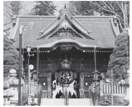
国指定文化財の成田山新勝寺・仁王門

災から守るためには、文化財関係者の努力だけでなく、市民一人一人が日常の心配りを積み重ねていくことが必要です。