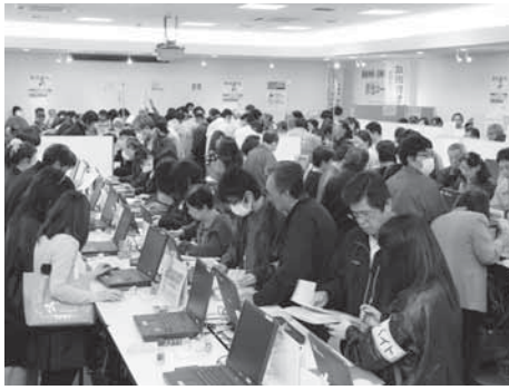
多くの人で混み合う申告書作成会場

期間中は、成田税務署内には確定申告作成会場を設けていません。期間 2月3日(月)～3月17日(月) (土・日曜日、祝日を除く。2月23日(日)・3月2日(日)は行いません)