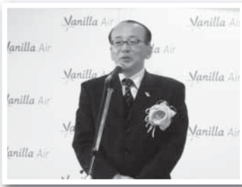
就航セレモニーであいさつ(20日)