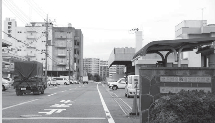
新鮮な食材の宝庫である成田市場

市では、市民の皆さんに市内の施設や発展状況を紹介し、市政に対する認識と理解を深めてもらおうと、毎年4回、施設見学会を開催しています。「施設見学会紙上ツアー」では、今までに見学した施設から、好評だった見学先にスポットライトを当て、皆さんに紹介します。