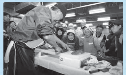
魚のさばき方を目の前で伝授(11月20日のお魚教室)

12月23日(月・祝)から、正月用品も店頭に並びます。この機会にぜひ一度、成田市場に足を運んでみませんか。