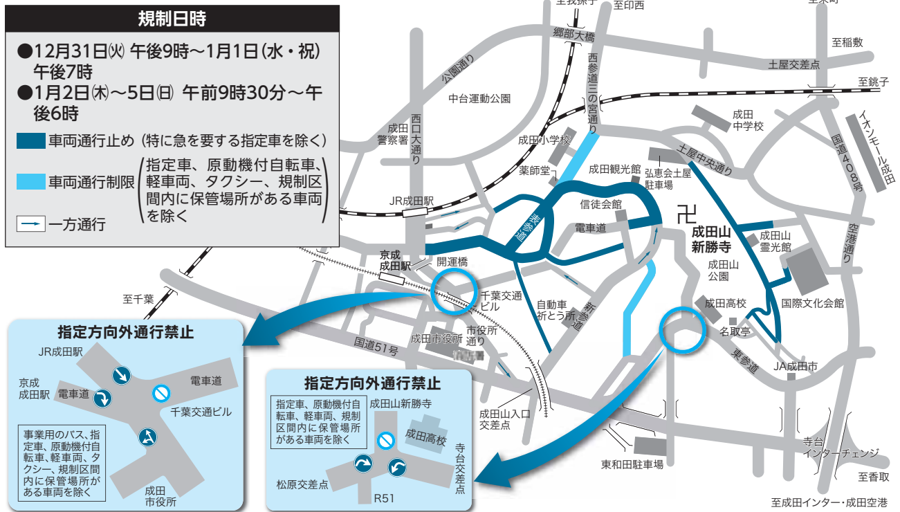
交通規制図① (第1種交通規制)

年末から年始にかけて、参拝客などで成田山を中心に市街地が混雑します。そこで、交通の安全と混雑の緩和を図るために第1種交