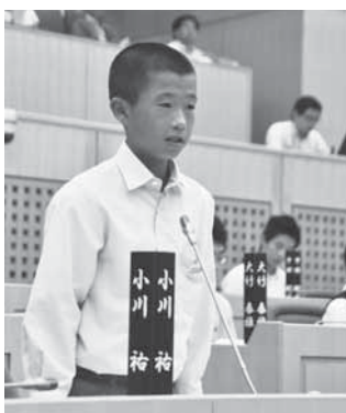
答弁を受けてさらに質問