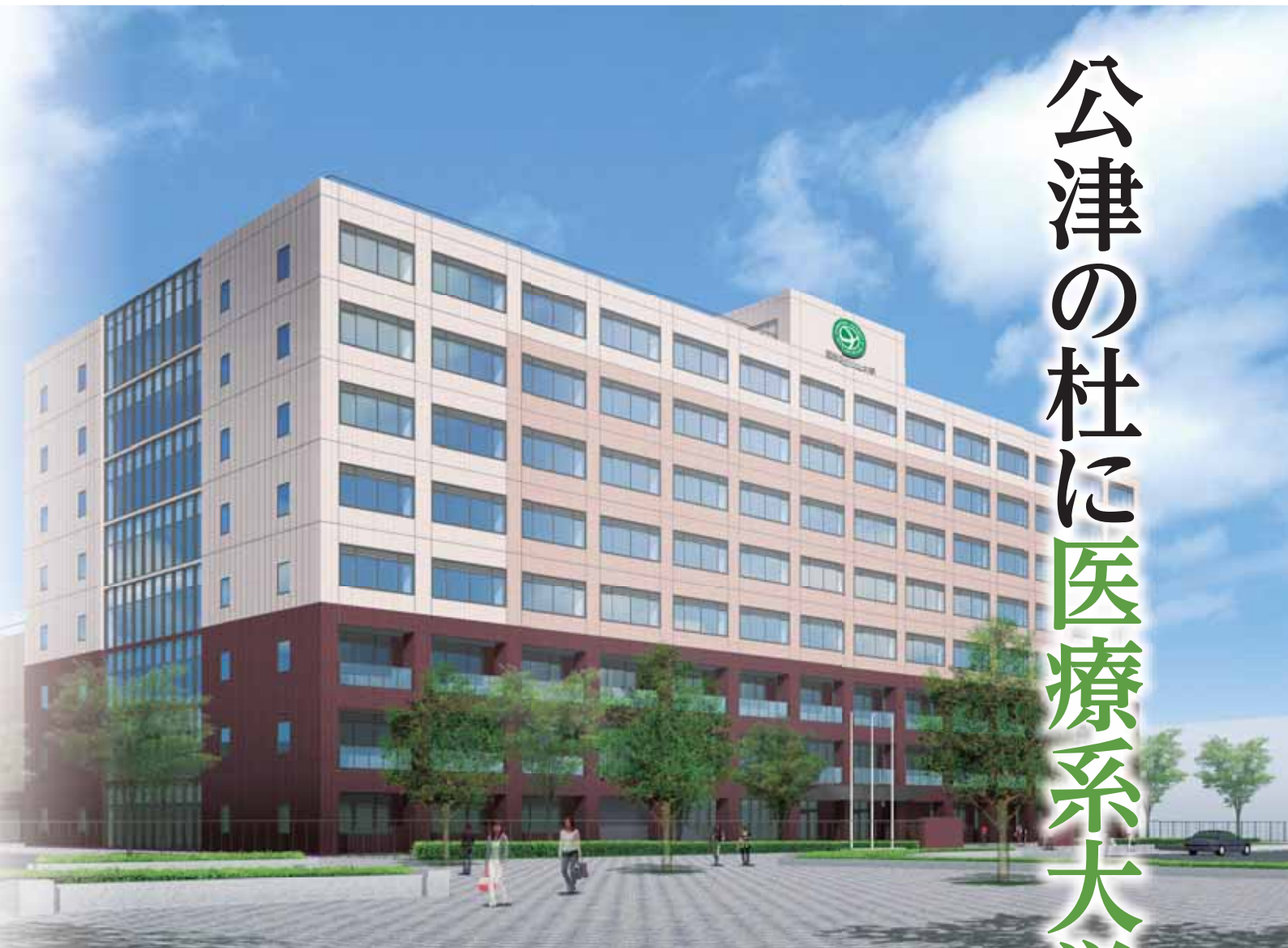
完成予想図(イメージ)

市では、平成28年4月開校を目指し、公津の杜駅の隣接地に、医療福祉の総合大学として栃木県や神奈川県・福岡県などにキャンパスを展開している「国際医療福祉大学」を誘致する計画を進めています。