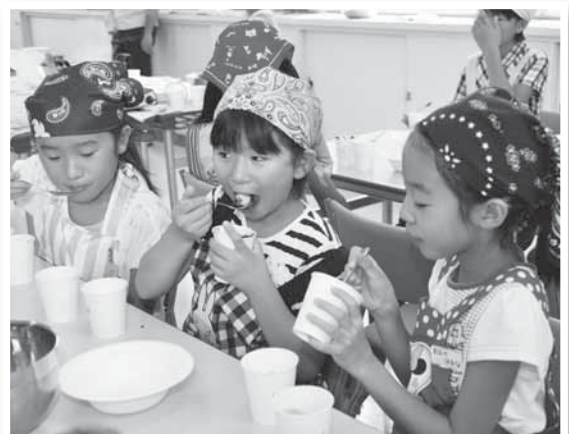
おいしくできたかな