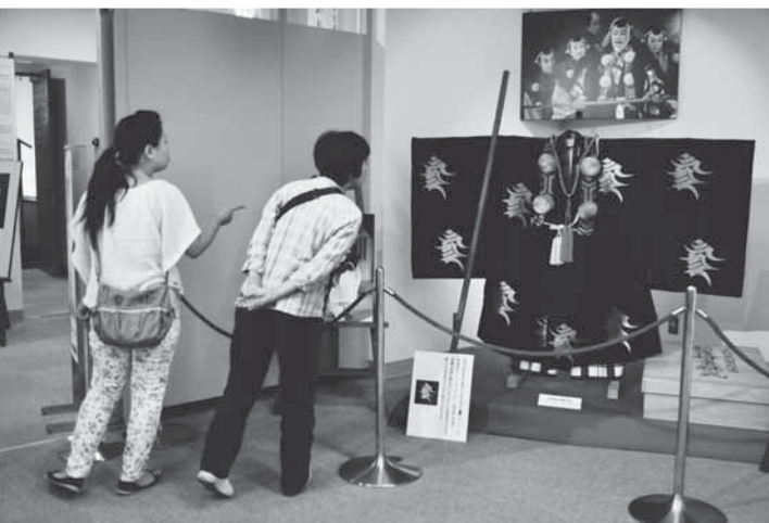
11代目が着用した勳進帳弁慶の衣装も