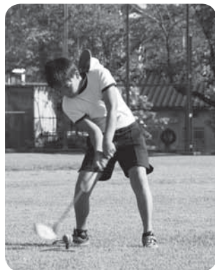
ボールをよく見て

「なんとなく面白そう」と思って入りましたが、今はスナッグゴルフが大好きです。2年連続でこのクラブを選びました。