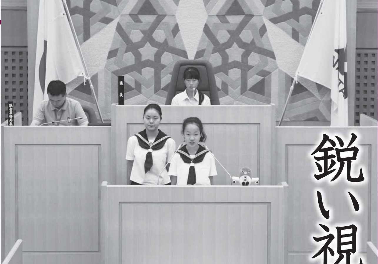
質問を読み上げる中学生議員

中学生に議会の役割や仕組みを学んでもらい、市政に対する関心を深めてもらうと「中学生議会」が8月21日、市議会議場で開催されました。今年度は、市内11中学校から代表24人が出席。議長選挙で選ばれた議長役の生徒の議事進行により、身近な問題から市の将来に関することまで、中学生の視点からさまざまな質問が出されました。今回は、各議員の主な質問とそれに対する答弁の一部を紹介します。