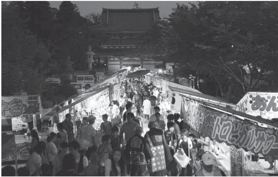
大勢の人でにぎわう宗吾霊堂境内