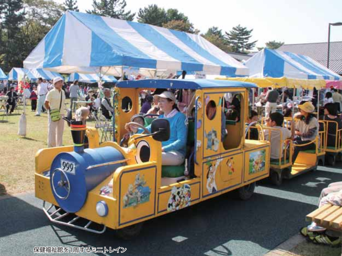
保健福祉館を1周するミニトレイン