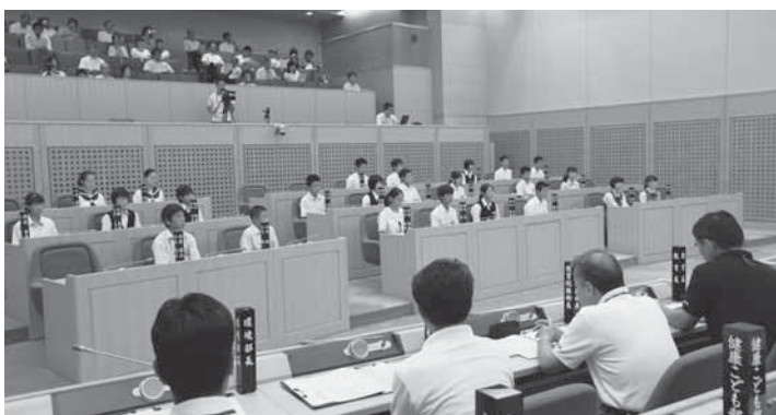
市議会をそのまま再現