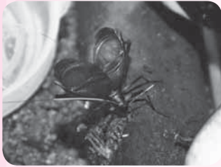
広げた羽をこすり合わせて鳴く

「土は常に少し湿った状態を保ち、餌にカビが生えないように気を付けて」とアドバイスするのは、メンバーの1人で飼育歴40年以上の長