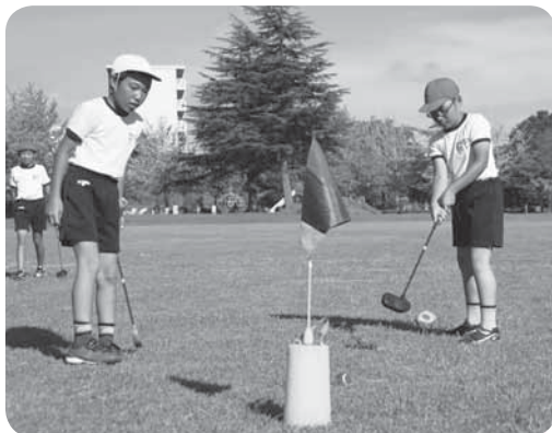
慎重にパッティング