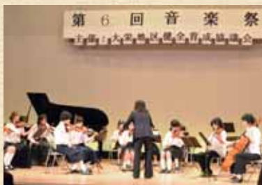
オーケストラの演奏

日時=10月20日(日) 午前11時開演(開場は10時30分) 会場=大栄公民館 プラザホール 出演者=大栄地区の小中学生、富里高校ジャズオーケストラほか 入場料=無料 ※くわしくは大栄地区青少年健全育成協議会・軸屋さん(☎090-4436-3640)へ。