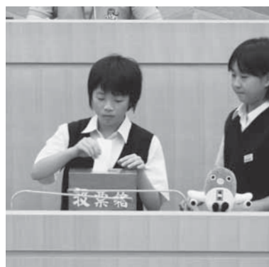
投票で議長を選出