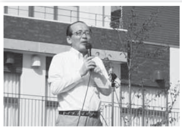
公津の杜中学校であいさつ(14日)