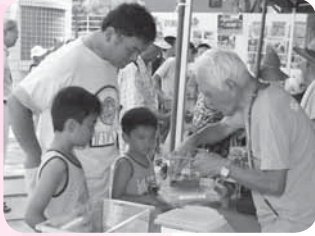
飼い方を熱心にアドバイス