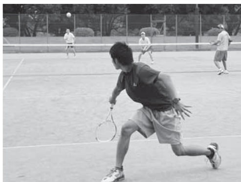
バックハンドでレシーブ

市内外からダブルスチーム63組が参加し、「オープンソフトテニス大会」が8月25日、中台運動公園テニスコートで開催されました。大会は、レベルごとに振り分けられた男子1~4部、女子の部、ミックスの部に分かれて実施。各部とも予選リーグと、その上位チームによる決勝トーナメントが行われました。時折、雨に降られる悪天候の中、選手たちは勝利を目指し奮闘。強豪が集い、ハイレベルな試合を繰り広げる男子1部では、ほかの部の出場選手など多くの方が試合に見入っていました。