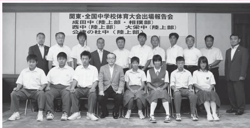
大会の出場者と関係者