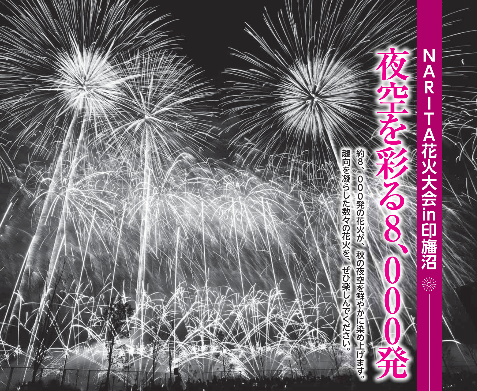
夜空に広がる大輪の花火

約8、000発の花火が、秋の夜空を鮮やかに染め上げます。趣向を凝らした数々の花火を、ぜひ楽しんでください。