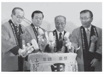
アウトレットの完成を祝って(19日)