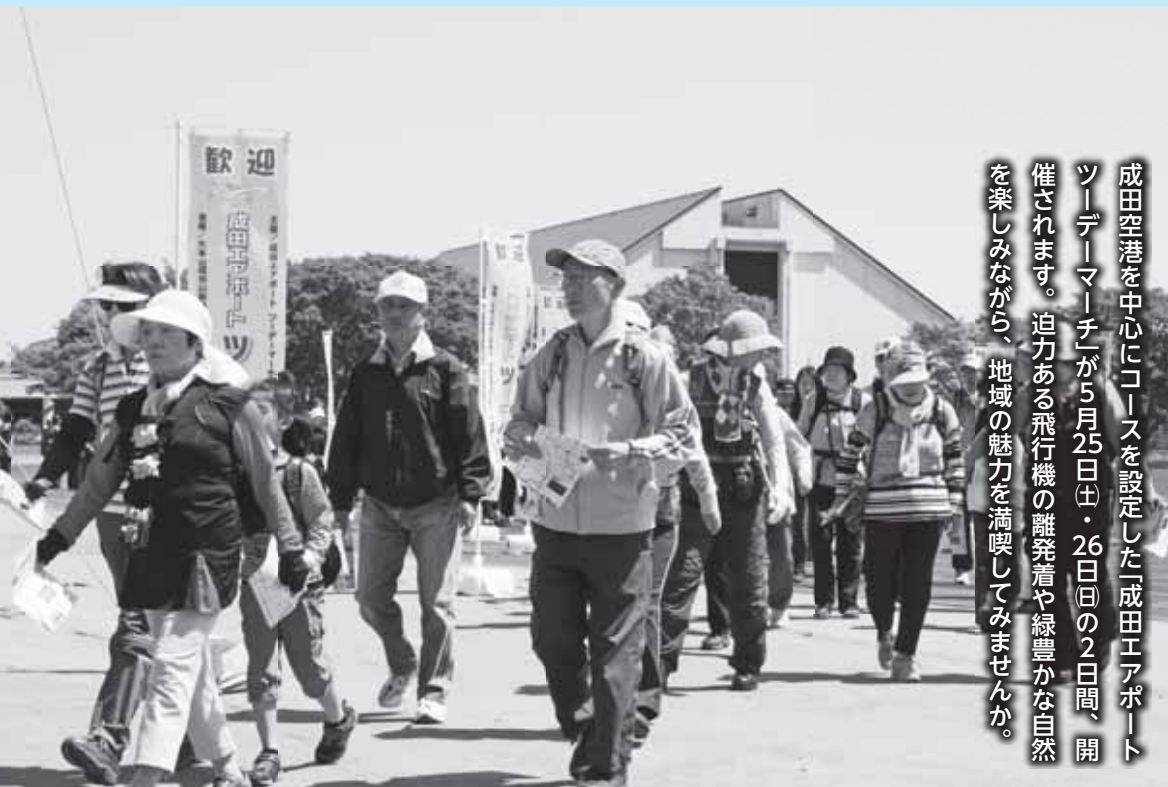
中台運動公園から、さあスタート

成田空港を中心にコースを設定した「成田エアポート ツーデーマーチ」が5月25日(土)・26日(日)の2日間、開催されます。迫力ある飛行機の離発着や緑豊かな自然を楽しみながら、地域の魅力を満喫してみませんか。