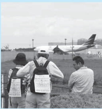
飛行機を見て、ほっと一息

市街地を抜けて、迫力ある飛行機の離着陸シーンを楽しめる「さくら」の山を巡り、取香川沿いを歩きます。里山の新緑を満喫できるコースです。