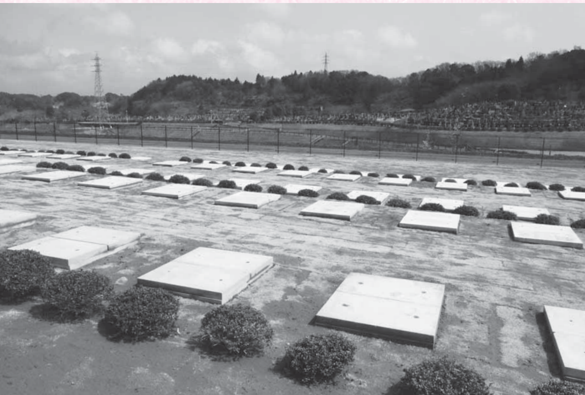
今回募集する区画