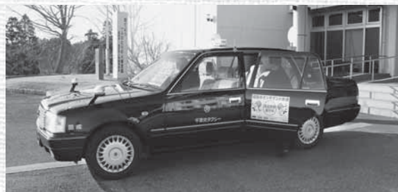
オンデマンド交通で外出が便利に

答オンデマンド交通は、自らがタクシーに乗り降りできる人を対象としています。介助を必要とする人は利用できません。