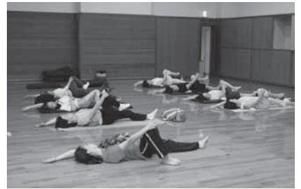
骨盤体操で体のゆがみを解消