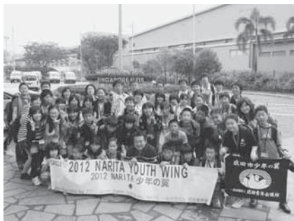
派遣先で仲間と記念撮影

※派遣期間は前後する可能性があります。くわしくは月・水・金曜日に同事務局(☎23-1900)へ。