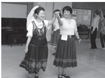
手を取り合って楽しく踊りましょう

※申し込みは3月29日(金)までに市レク リエーション協会事務局(生涯スポー ツ課・☎20-1584)へ。