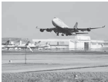
飛行機の離着陸を間近に見て

※くわしくは成田エアポートツーデーマーチ実行委員会事務局(観光プロモーション課・☎20-1540)、ボランティアについては同事務局ボランティア係(生涯スポーツ課・☎20-1584)へ。