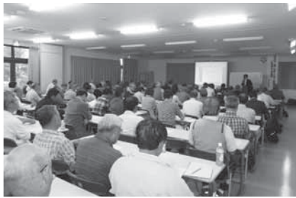
分かりやすく解説します

市では、平成25年度の受講生を募集 します。また受講生とは別に、会場づく りや受け付けなどを行う運営ボランティ ア「運営委員」も同時に募集します。定員 は各課程5人(応募者多数は抽選)で、受 講料を支払わずに受講できます。