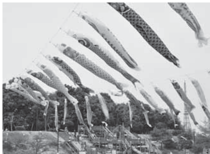
空一面を泳ぐこいのぼり

※提供されたこいのぼりは返却しません。くわしくは観光プロモーション課(☎20-1540)へ。